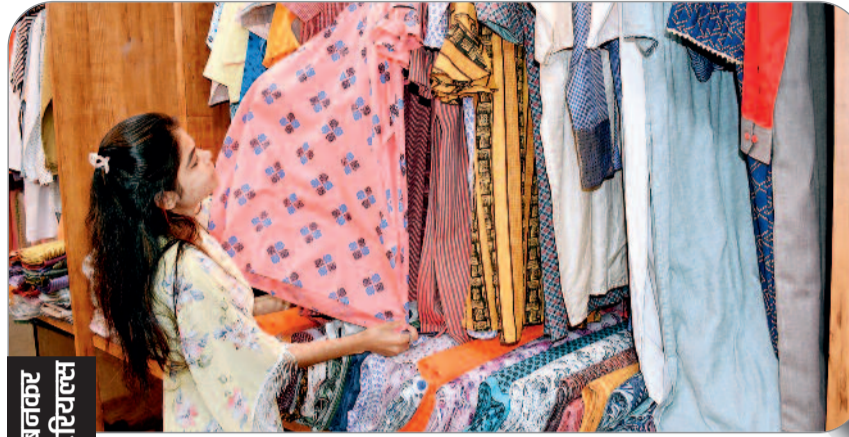
इन शहरों से बनकर आ रहे ड्रेस मटेरियल्स

शहर के युवाओं में खादी फैशन को लेकर जबरदस्त क्रेज देखा जा रहा है। शादी, पार्टी, कॉलेज वोकेशन के साथ-साथ डेली रूटीन में भी यंगेस्टर खादी के डिजाइनर आउटफिट को अपने वार्डरोब के कलेक्शन में जगह दे रहे हैं। खादी ड्रेस मटेरियल एक समय तक केवल सीनियर सिटीजन की पसंद हुआ करता था, पर अब यह हर वर्ग की पसंद बन गई है। ऐसे में युवाओं में खादी फैशन का क्रेज बढ़ाने राज्य खादी तथा ग्रामोद्योग द्वारा खादी ड्रेस मटेरियल्स की कड़ाई-बुनाई में नया प्रयोग किया जा रहा है।