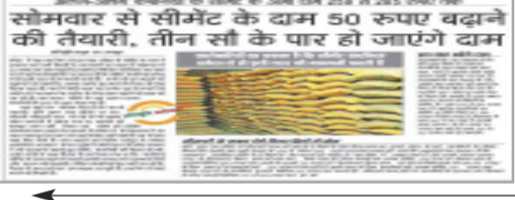
सोमवार से सीमेंट के दाम 50 रुपए बढ़ाने की तैयारी, तीन सौ के पार हो जाएंगे दाम

हरिभूमि न्यूज़ ►► रायपुर प्रदेश में एक बार फिर से सीमेंट कंपनियों की मनमर्जी सामने आई है। सोमवार से सभी कंपनियों ने सीमेंट के दाम 30 रुपए बढ़ा दिए हैं। खुले बाजार के साथ सरकारी काम में आने वाले नान ट्रेड सीमेंट के दाम भी बढ़े हैं। अब सीमेंट के दाम चिल्हर में 300 से 350 रुपए हो गए हैं। थोक में इसके दाम 260 से 340 रुपए हो गए हैं। जो सबसे महंगा नान ट्रेड सीमेंट ओपीसी का 310 रुपए था, वह 340 रुपए हो गया है। हरिभूमि ने पहले ही 4 अप्रैल के अंक में इस खबर को प्रमुखता से प्रकाशित किया था कि सीमेंट के दाम सोमवार से बढ़ाने की तैयारी है। अभी दाम 30 रुपए बढ़े हैं आने वाले समय में इसके दाम और 20 से 30 रुपए बढ़ाने की तैयारी है।