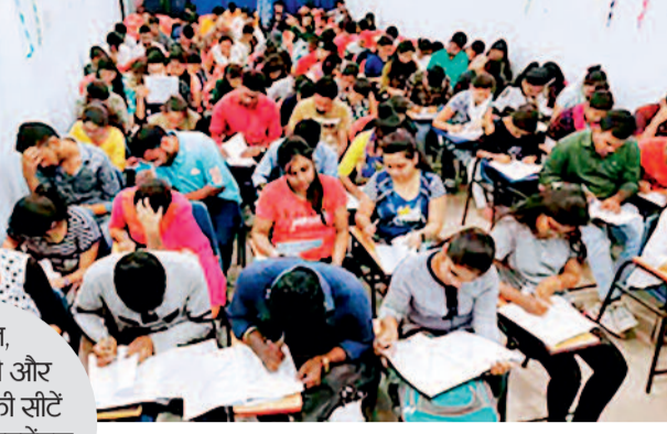
मेडिकल, ट्रिपलआईटी और आईआईटी की सीटें बढ़ने के बाद स्टूडेंट्स की पहली पसंद बन रहा छत्तीसगढ़