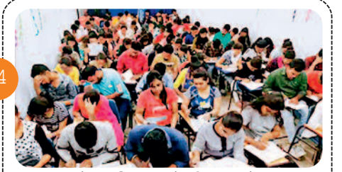
कॉलेज की पढ़ाई के लिए दूसरे ....